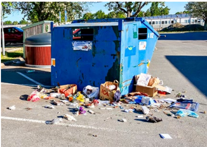
En måndagsmorgon på Jakobsberg möts hyresgästerna av den här synen vid miljöstationen.

Kom ihåg att du ska logga in på marknad.salabostader.se (om du inte är ute efter lägenhetsdeklaration eller tvättstugebokning online – då gäller minasidor.salabostader.se ).