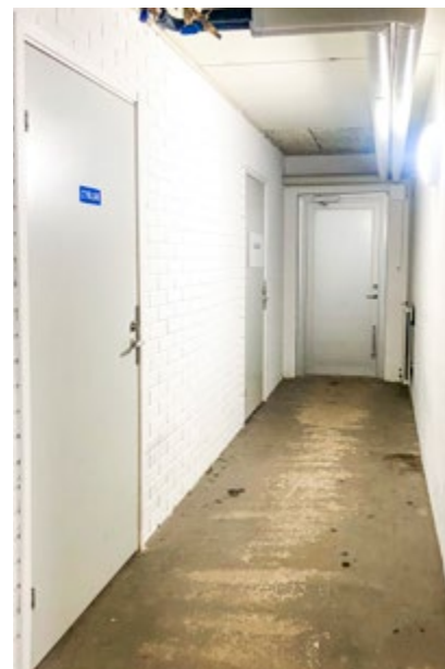
Det är så här vi önskar att alla våra trapphus och källare ska se ut.